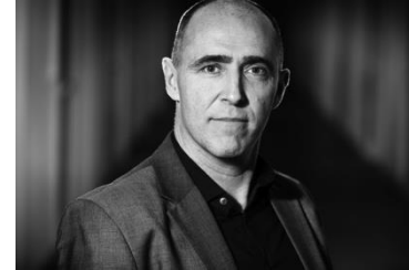
Mats Paulsen Kommunikation